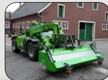
KM an Merlo Teleskoplader