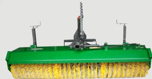
Scheibenbesen mit Poly-Well Besatz

Hydraulisch oder mechanisch angetriebene Kersten Front- und Heckanbau-Kehrmaschinen für den ganzjährigen Einsatz bei der Arealpflege und dem Winterdienst. Ideale Anbaumöglichkeit bei vielen RADLADERN, TELES-KOPLADERN, GABELSTAPLERN und SCHLEPPERN.