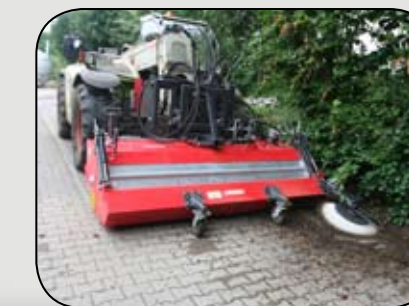
Kompaktkehrmaschine für Teleskoplader