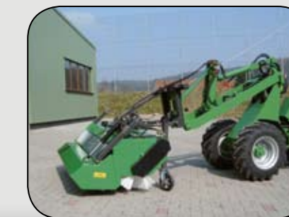
KM am Hoftac