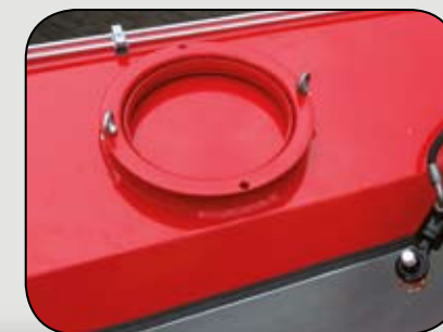
Kugeldrehkranz zum Schwenken (Ø 300 / 400 mm)