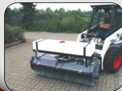
KM mit Vollstahlbesen an Bobcat

Anbau-kompatibel zu nahezu allen Radladern, Teleskoplädern und Gabelstaplern durch Anpassung an viele Euro-Normen und 3-Punkt-Aufnahmen. Sonderanbauten sind auf Anfragen natürlich ebenfalls möglich