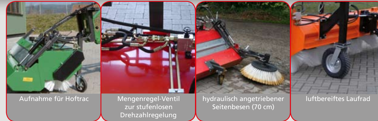
Aufnahme für Hoftac