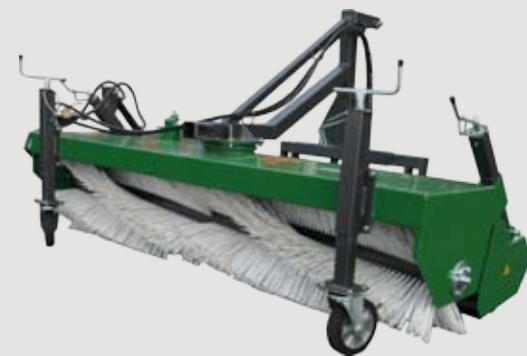
Kompaktkehrmaschine mit Kombiwalze (52 cm)

Vielseitige Einsatzmöglichkeit durch unterschiedliche Arbeitsbreiten (Variable 125 - 270 cm), Kehrwalzendurchmesser (52 & 60 cm).