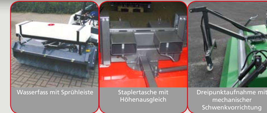
Wasserfass mit Sprühleiste