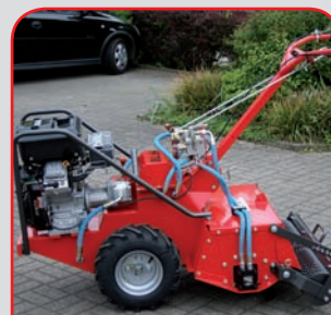
HF 700 DUO: Profi-Umkehrfräse mit Gitterwalze