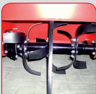
Fräswerk und höhenverstellbarer Bremsporn