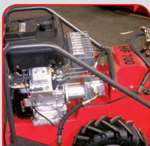
Rammschutz und Kranverladeöse