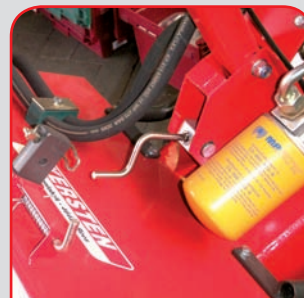
Höhenverstellung des Handholms werkzeuglos