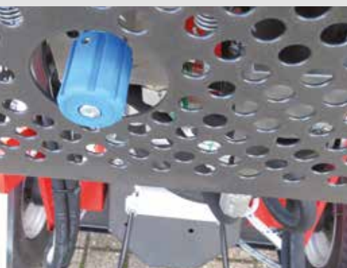
Regelpatrone zum Freischalten des Fahrtriebs