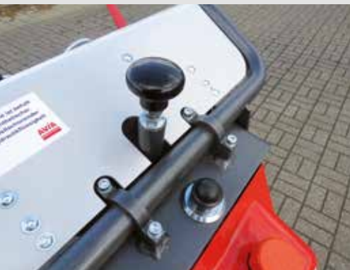
Rastknopf für Seitenverstellung des Handholms links/rechts 30 Grad