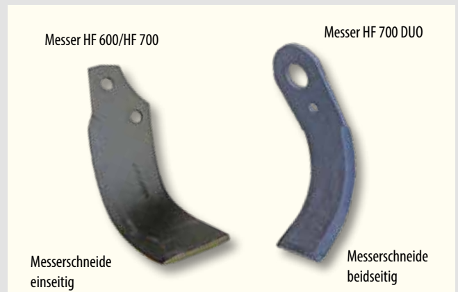
Messer HF 600/HF 700