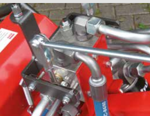
Hydraulikventil für alle Funktionen