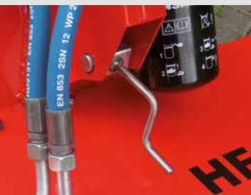
Kurbel zur Verstellung der Arbeitshöhen