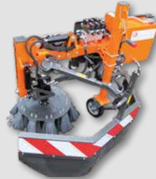
UB 6080 MH