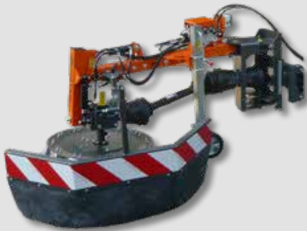
UB 6080 M