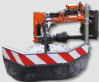
UB 6080 MK