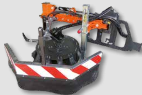
UB 6080 H