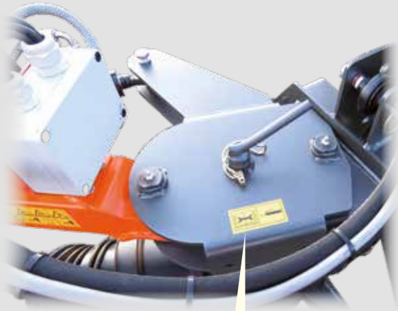
Zwischenbock zur Erweiterung des Arbeitsbereichs