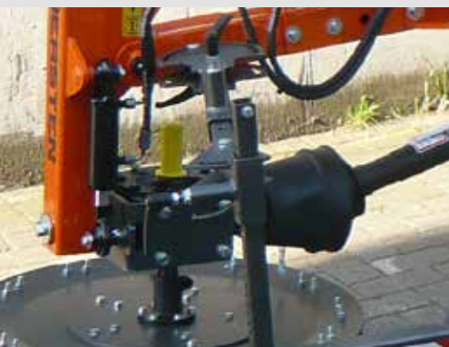
Getriebe drehbar für beide Laufrichtungen