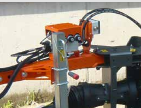
Hydraulikblock zur hydraulischen Verstellung der verschiedenen Arbeitswinkel